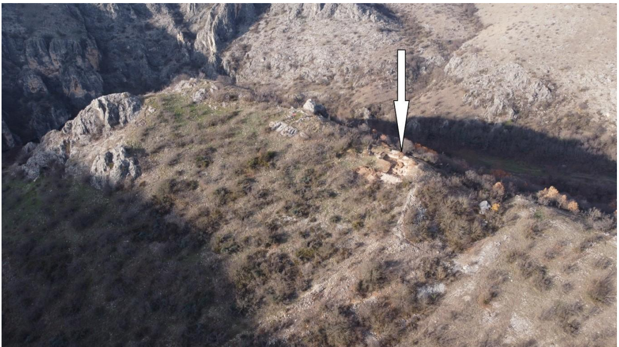
6. Снимка со дрон на истражуваниот дел