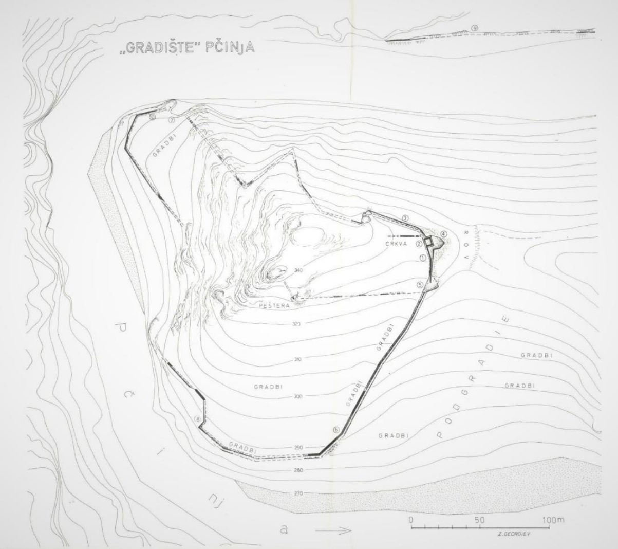
4. План на локалитетот