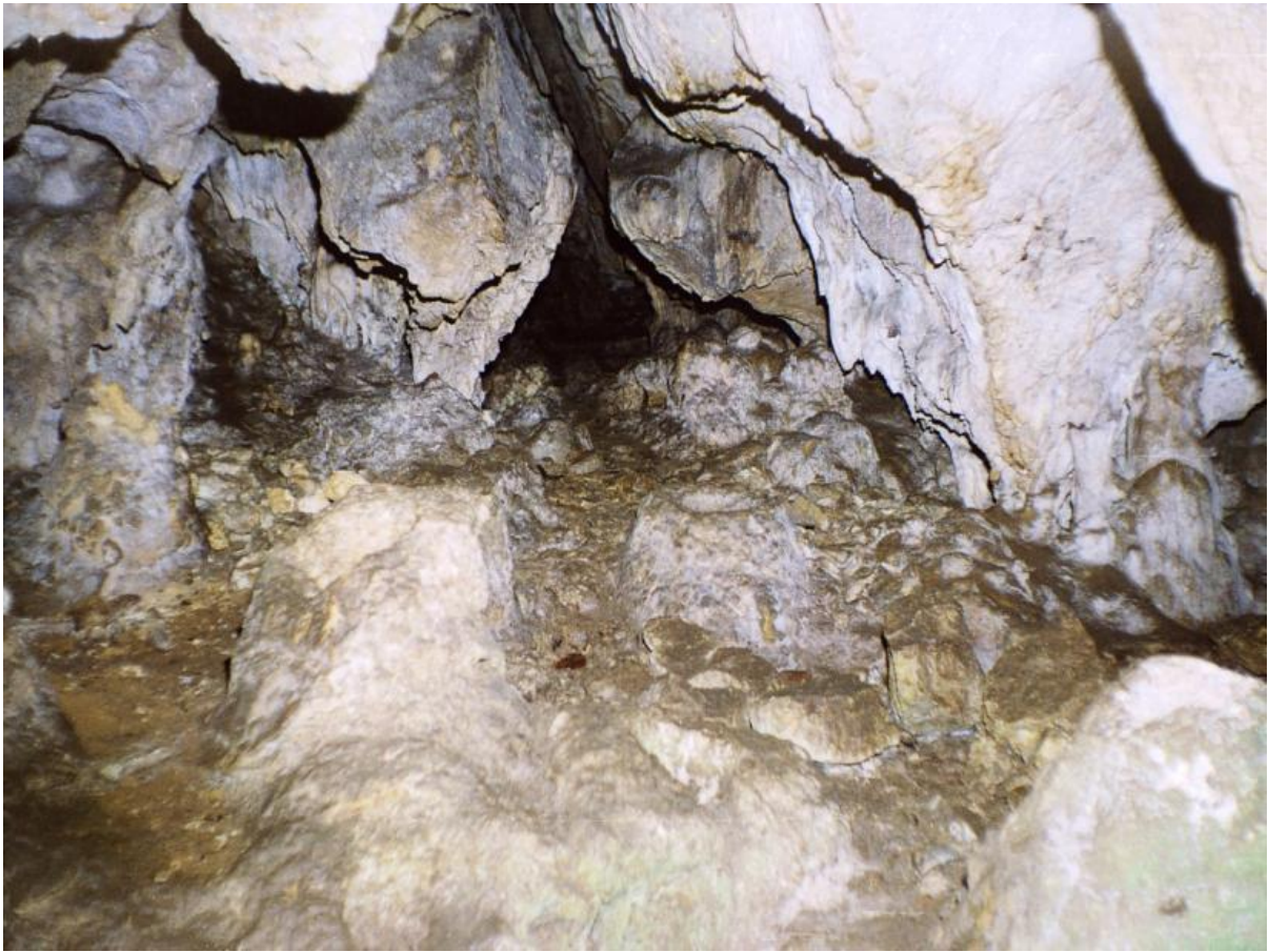
1. Лишков пештер, траги од човечко живеење