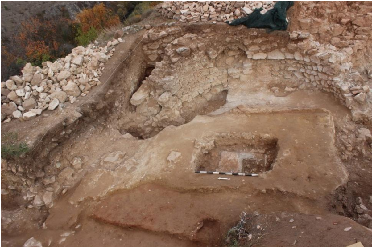
7. Олтар на ранохристијанска црква