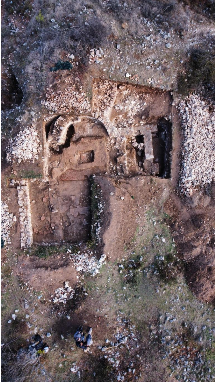
3. Градиште – ранохристијанска базилика