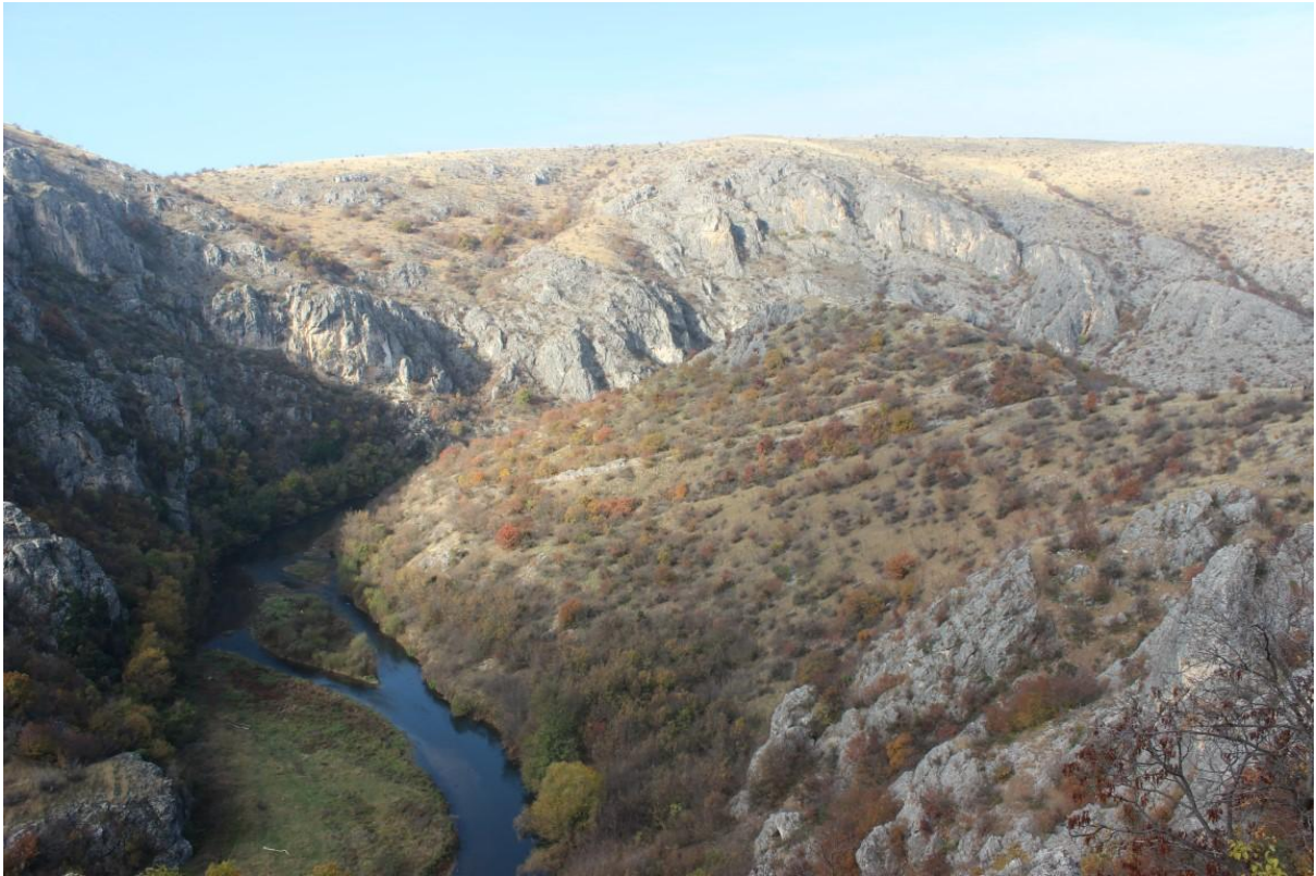
5. Поглед кон локалитетот од југ